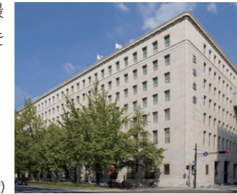
日本生命保険相互会社(本店)

これからも、生命保険事業は人々の生活を支える社会的な使命を帯びた聖業であるとの信念のもとに、長期的な視点から堅実で健全な経営を貫き、「保障責任の全う」、「お客様の利益の最大化」のために努力を重ねてまいります。