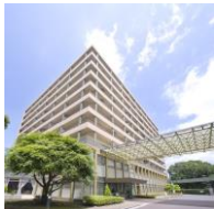
松戸ニッセイエデンの園 正面入口