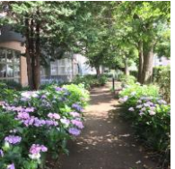
園内 すずかけの小径