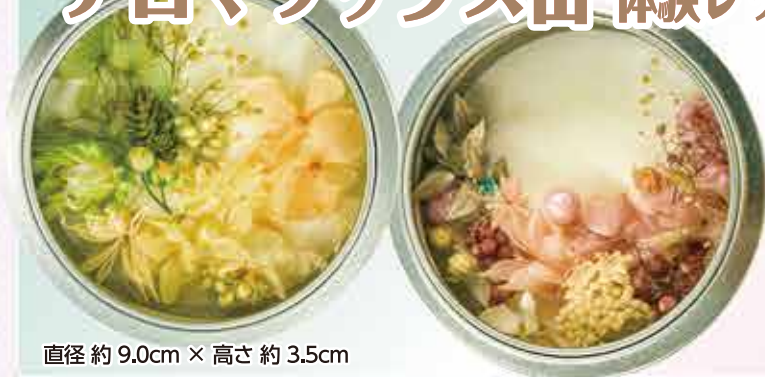
直径約9.0cm × 高さ約3.5cm

缶のアロマワックスにお花をアレンジします 磁石付きなので冷蔵庫などに付けられます 火がなくても バラのアロマオイルの香りを楽しめます